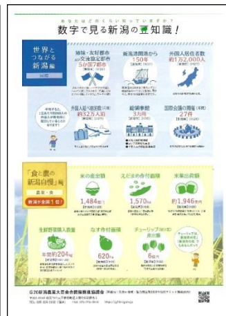
【パンフレット（A3版2つ折り）】