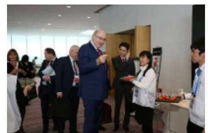
【2016年G7新潟農業大臣会合の様子】

募集開始は9月中旬頃を予定しており、詳細が決定次第、新潟市HPや市報にいがたなどでご案内いたします。